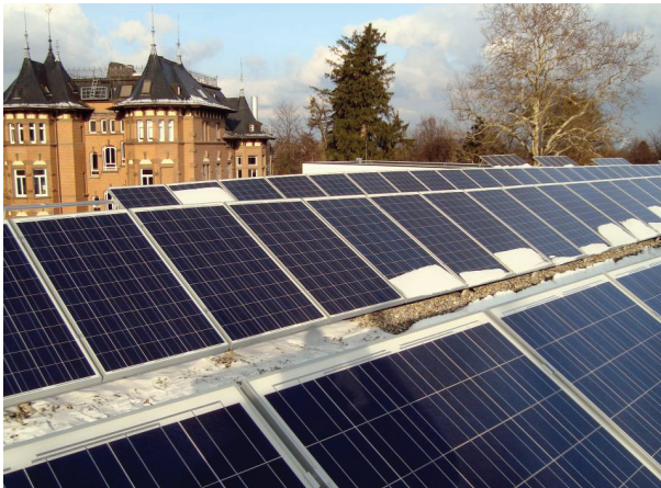
Blick auf die PV-Anlage auf dem Dach des Bettenhaus der Evangelischen Akademie Bad Boll

Im Dezember 2009 ging die erste Genossenschaftsanlage mit einer Leistung von 31,1 kWp auf dem Dach des